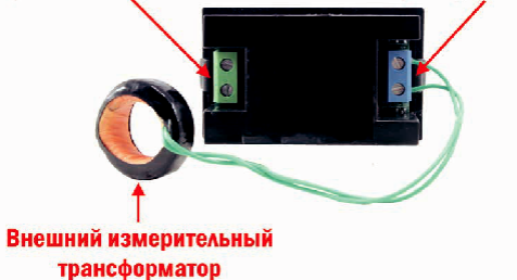
Рис. 1 – Задняя панель

Клеммы для измерения напряжения и для питания Клеммы для подключения внешнего трансформатора